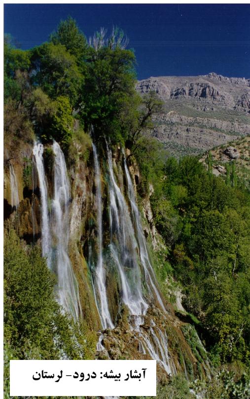
آبشار بیشه: درود - لرستان