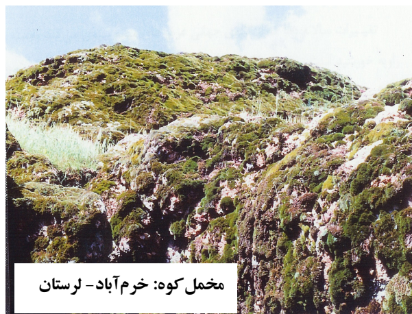
مخمل کوه: خرم آباد - لرستان