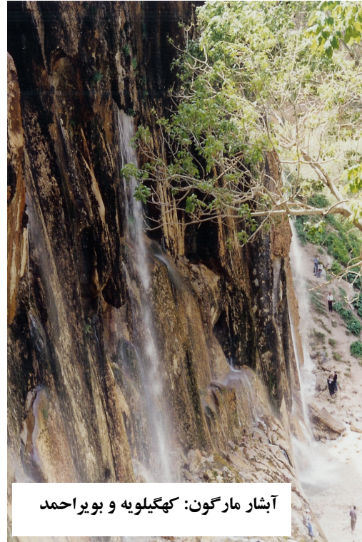
آبشار مارگون: کهگیلویه و بویراحمد