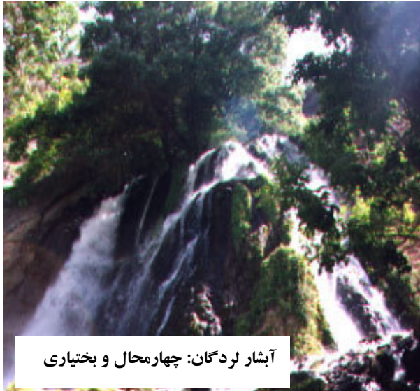
آبشار لردگان: چهارمحال و بختیاری