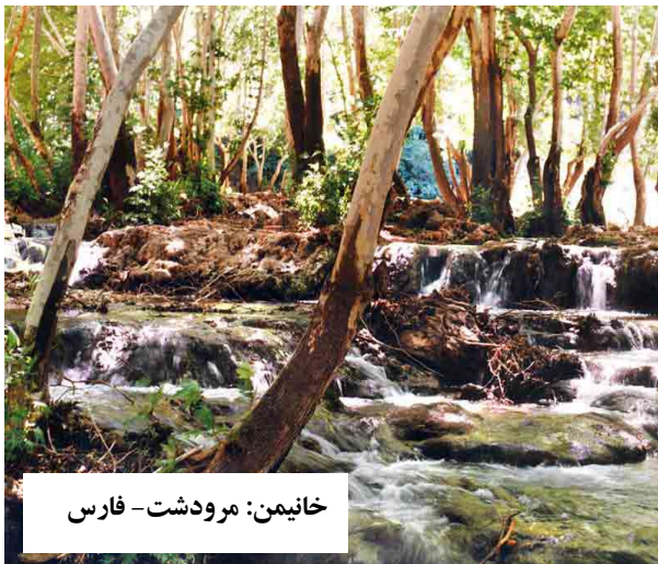
خانمین: مرودشت - فارس